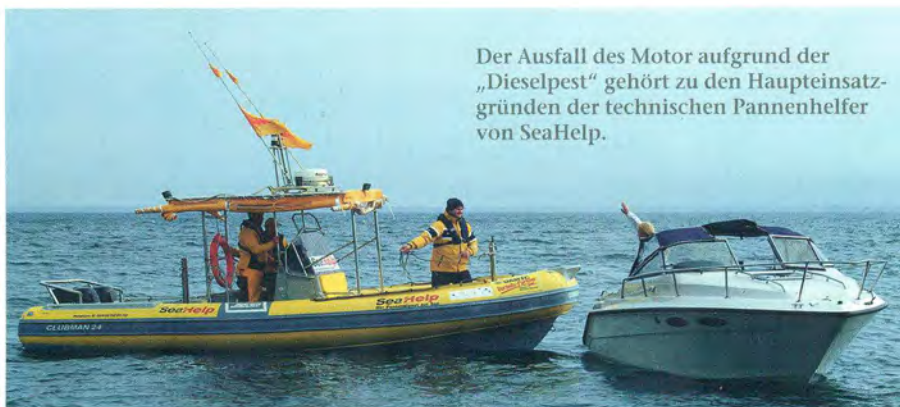
Der Ausfall des Motor aufgrund der „Dieselpollen“ gehört zu den Haupteinsatzgründen der technischen Pannenhelfer von SeaHelp.